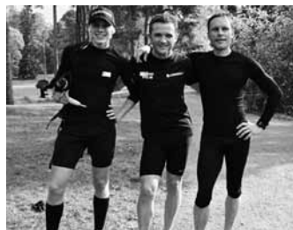
Trion som vann

Text: Gunilla Svedlund