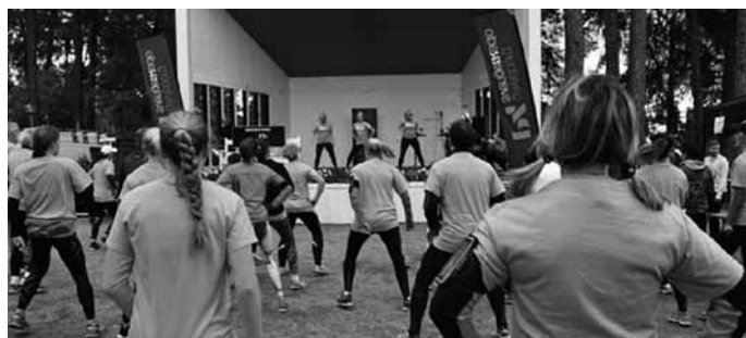
Uppvärmning till musik