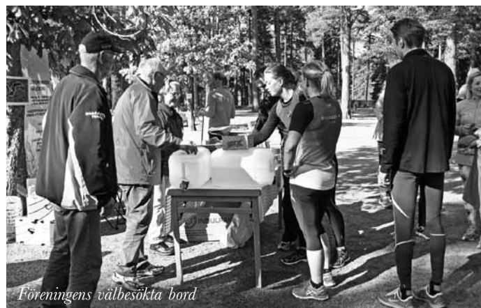
Föreningens välbesökta bord

Radio Gävleborg arrangerade för andra året i rad P4-milen som direktsändes i radio. Fredagen den 29 maj var det samling för både unga och gamla i Boulognersskogen och Cancerföreningen Gävleborg fick återigen chansen att visa upp att föreningen finns genom att ställa upp med volontärer och förfriskningar.