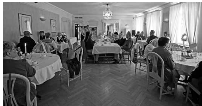
Lunchen på Skantzens Brukshotell