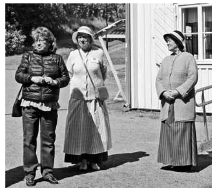
Resans tre guider