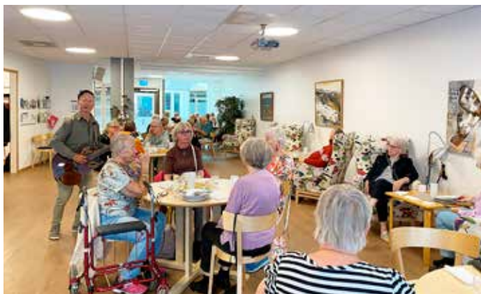
Text och foto: Gunilla Svedlund

Efter en skön sommar kom så hösten och därmed kom också verksamheten i föreningen igång. Höstens första medlemsmöte hölls den 8 september i Träffpunkten för seniorers lokal på Kansligatan 10 i Gävle. Vi brukar starta upp med sill och potatis, så gjorde vi även detta år. Det blev ett mycket trevligt möte och många var det som kom. Vi var 28 st som underhölls av Trubaduren Walle och som var med i lotteriet där vinstbordet dignade av ätbara vinster.