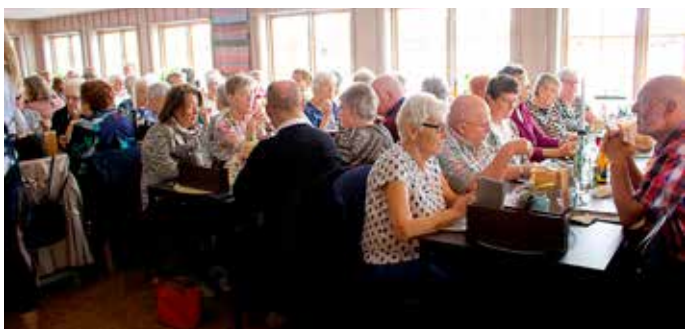
Text och foto: Gunilla Svedlund